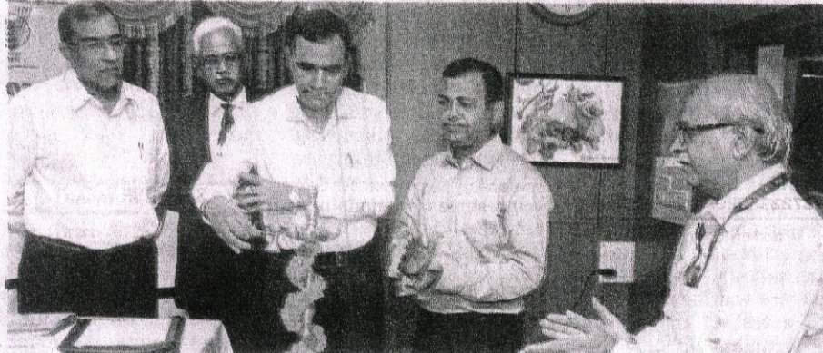
Officials from Goa agriculture department, IISR Calicut, KAU, Thrissur seen at the inaugural function of district-level spice production seminar at Ela, Old Goa.

While delivering the inaugural address, D P Dwivedi, Secretary (Agriculture), government of Goa, highlighted the recognition of Goa due to trading of black pepper and cashew. He emphasised on the trend of increase in black pepper price due to increased demand coupled with decreased production in the state which